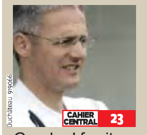
CAHIER CENTRAL 23

PS Deux candidats pour la présidence verviétoise