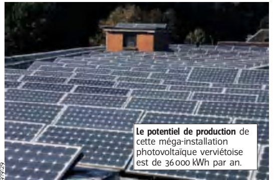
Le potentiel de production de cette méga-installation photovoltaïque verviétoise est de 36 000 kWh par an.

La société verviétoise Issol vient de réaliser la plus grande installation photovoltaïque connectée au réseau et ce, pour le compte d'une PME voisine, l'entreprise Alan & co. Spécialisée dans les produits médicamenteux, cette société est installée quai de la Vesdre, en face du parc à conteneurs verviétois. Sur sa toiture de 1200 m 2 , on trouve désormais 264 panneaux solaires photovoltaïques. A ne pas confondre avec les panneaux solaires thermiques qui utilisent le soleil pour produire de l'eau chaude. Ici, il s'agit de transformer l'énergie solaire en électricité. Le potentiel de production est de 36 000 kWh par an et la durée de vie garantie au-delà de 30 ans. L'installation de