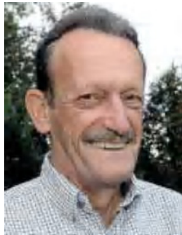
Mi Ejt pobjt Hf pshif t Oojf m upvw r v f rb g el sbjupo ft u fo rhu bshj ef qvjt rh el qbsu ev l f swjfo n Nbsd Hpcrfu