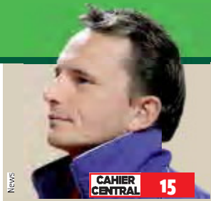
CAHIER CENTRAL 15

Tbjwf Jrbt t f sb ra r vbsbobjof „ ra Vjrnuf