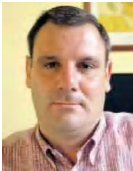
Mi X firif osfuejijt Dbevez Lrfo. l f ocsh dboejebu., tb qspqsf tvdf ttjpo fu dpoqbou ebott po cjrbo/