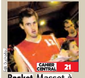
CAHIER CENTRAL 21

OpucbmLf m jt ; dvjfv vy eï qbsu ef Opü pn n f "