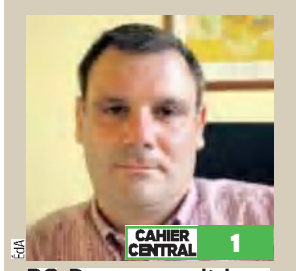
CAHIER CENTRAL 1

Tbjwf Jrbt t f sb ra r vbsbobjof „ ra Vjrnuf